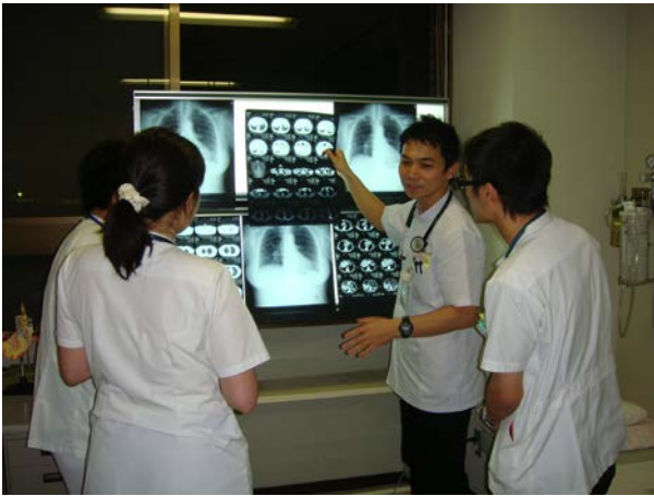
図1 検査データによる患者の状態把握

内科病棟に入院している患者さんの治療をするときには、レントゲンやCT、血液検査など病院で調べた様々なデータから患者さんの病状を把握してその人に合った最適な鍼灸治療を検討します。また検査データによって鍼灸治療の効果を判定しています。